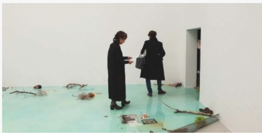
Detalj iz nacionalne postavke Francuske