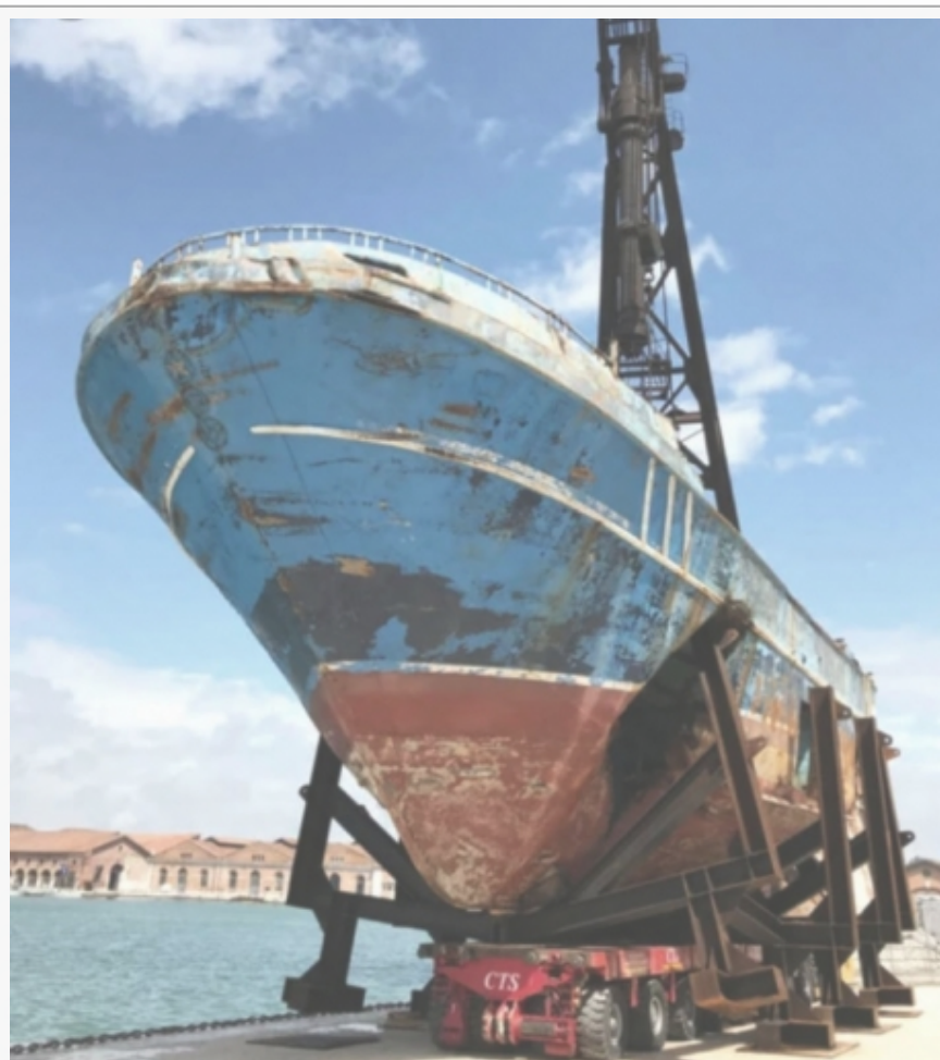
Kristof Buhel, Barca Nostra

pseudonim – kompjuterski generisanu kombinaciju pogrešno napisanih varijanti njenog imena i prezimena koja "briše" njeno iransko poreklo. Umetnica, na čijoj se stranici na vikipediji mogu pronaći svesno kontradiktorni podaci: da je rođena "u Budimpešti 1987, Minhenu 1979, Teheranu 1967. i Londonu 1966. godine", na pres-konferenciji i zvaničnom otvaranju Paviljona lice je sakrivala iza ogromne maske. Čitav Nemački paviljon zapravo predstavlja metaforu evropske politike izolacije, a temu migracione politike, segregacije i kolektivne odgovornosti tematizuje i švajcarsko-islandski umetnik Kristof Buhel koji je, u prostorima Arsenala, izložio ribarski brod Barca Nostra ( Naš brod ), na kojem je 2015. godine između Libije i italijanskog ostrva Lampeduza stradalo oko hiljadu migranata. Pošto je olupina izložena bez naziva i objašnjenja (koje istina postoji u samom Katalogu Bijenala), po mnogima joj nedostaje kontekst jer budući da se nalazi u prostoru nekadašnjeg brodogradilišta Arsenala, u blizini restorana, posetoci bez ikakve ideje o tragediji, ispred simbola masovne grobnice, uživaju u hrani i piću ili se fotografišu. Što je, verovatno, i bio umetnikov cilj.