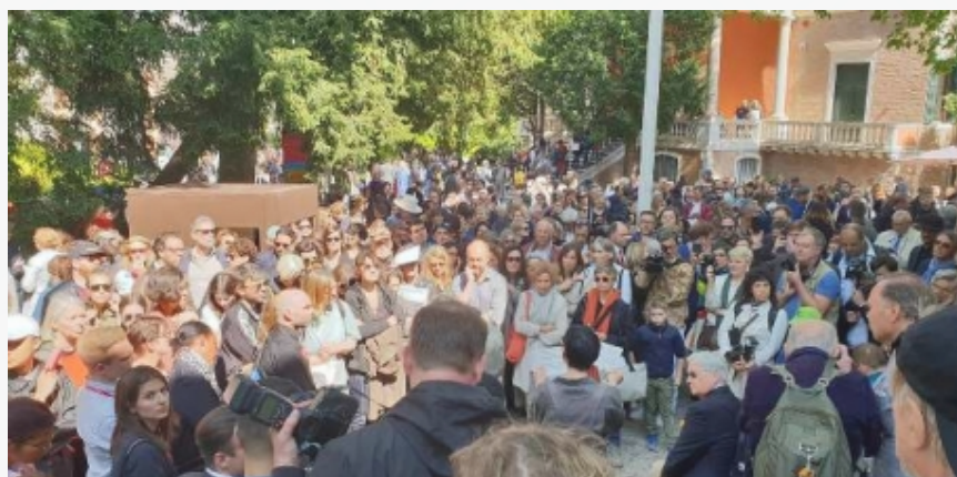
Sa otvaranja Paviljona Nemačke

protest protiv desničarskog ministra kulture, prvi put samostalno izlaže jedna žena, feministkinja, Renate Bertlman.