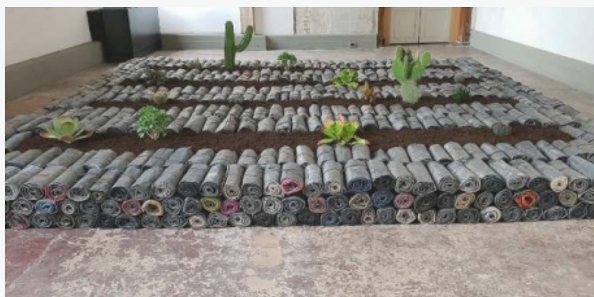
Retrospektiva Janisa Kunelisa