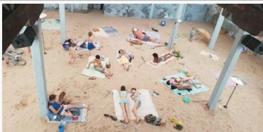
Nagrađeni Paviljon Litvanije

Pošto su organizatori 58. Bijenala vodili računa o zastupljenosti ženskih autora, izlaže jednak broj muškaraca i žena. Žene-umetnice su nagrađene u kategoriji nacionalnih paviljona – Zlatni lav je pripao Paviljonu Litvanije za "performans-operu" pod naslovom Sunce i more (Marina) .