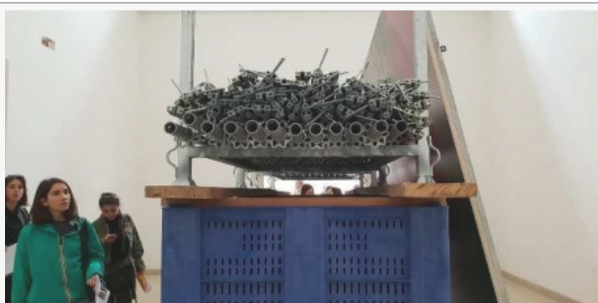
Sa postavke u Paviljonu Nemačke