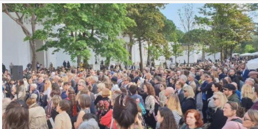
Otvaranje nacionalne selekcije Austrije

U Paviljonu Francuske odnos realnog i fiktivnog, te pitanja ko smo, odakle dolazimo i kuda idemo istražuje dobitnica Turnerove nagrade Lora Provo (Laure Prouvost), dok rituale svakodnevice te pojmove dematerijalizacije i odsustva, u Paviljonu Velike Britanije, propituje Irkinja Ketil Vilks (Cathy Wilkes).